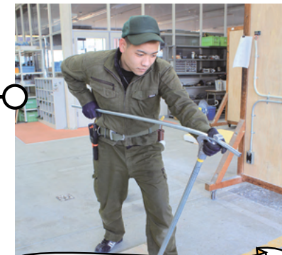
金属管工事 (動力・電灯工事)