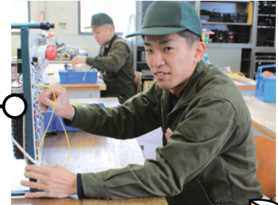
単位作業 (第二種電気) ケーブル工事シーケンス制御