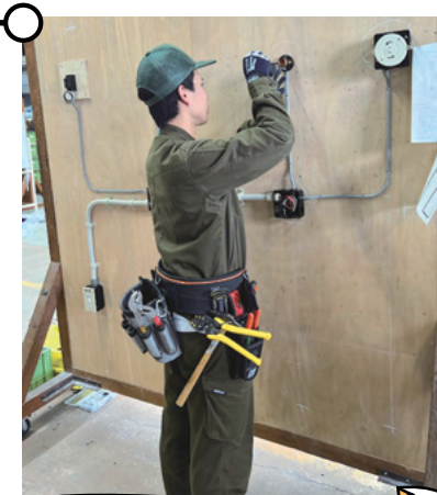
樹脂管工事 (動力・電灯工事)