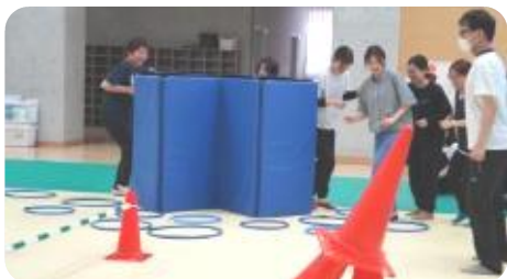
チームでジャングル鬼ごっこの環境づくり