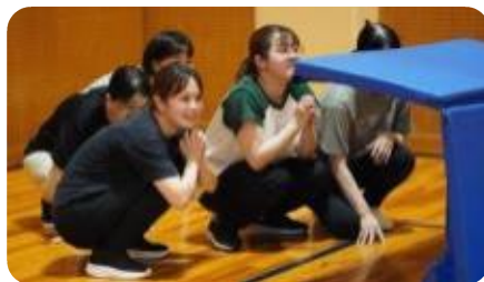
子どもの気持ちになって実践