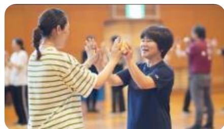
ペアでボールの手渡し