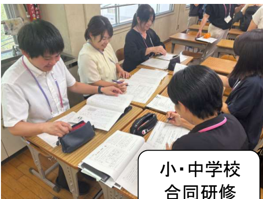
小・中学校 合同研修