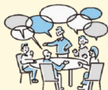
外来医療に関する地域の協議の場