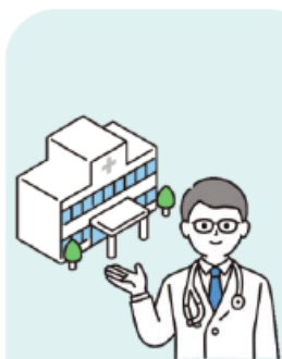
かかりつけ医機能報告 対象医療機関