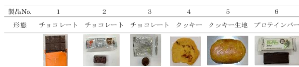
表1 大麻含有食品の概要