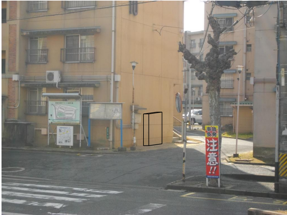
県営引野団地における自動販売機設置仕様書について