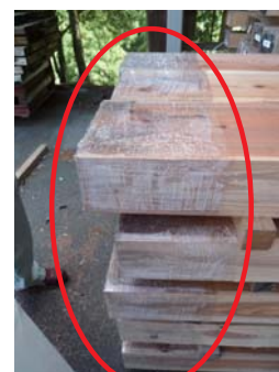
写真3 木口部分をカバーした天然乾燥材

また、木口からの乾燥を抑える方法として、木口に塗料等を塗る、木口をシートで覆うのも効果があります。この方法は天然乾燥で行われることがあります。