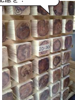
写真2 棧積みした材端部の様子