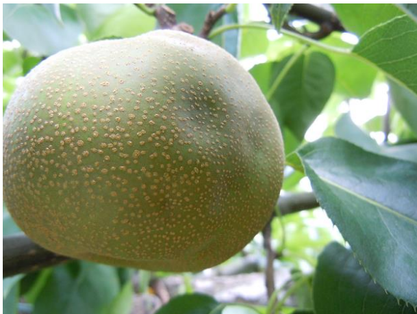
図4 果樹カメムシ類による被害果（ナシ）