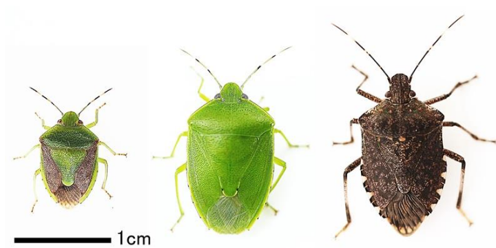
図3 果樹カメムシ類（左からチャバネアオカメムシ、ツヤアオカメムシ、クサギカメムシ）