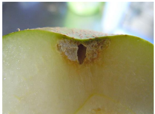
図5 果樹カメムシ類による被害果断面（ナシ）