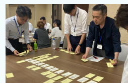
グループワーク情報交換