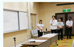
グループワーク発表

視察・実習等の予備日[11/26 水] ▲…木材供給者、施工者とともに受講します