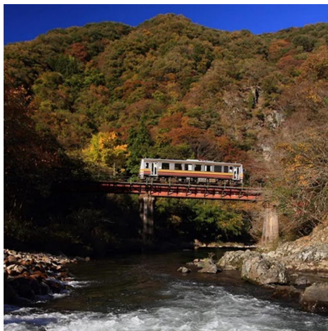
芸備線を走行する列車（キハ 120）