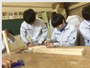
尾道特別支援学校 しまなみ分校

お菓子は、おのみちの「ねこ」「レモン」を取り入れてお菓子にしました！ブレンドコーヒーは、尾道浪漫珈琲×尾道特別支援学校コラボ！深みのクロネコブレンド、すっきりミケネコブレンド。窯業製品は、向島東製陶所の方に教えてもらい作りました！使いやすさ抜群！