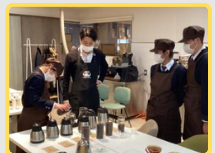
地元珈琲専門店とコラボ開発した ブレンドコーヒー