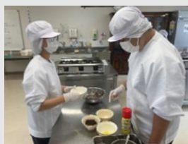
福山北特別支援学校

誰でも楽しめるスポーツ「ボッチャ」を体験してみませんか？初めての方でも簡単にできるルールなので安心して参加できます！