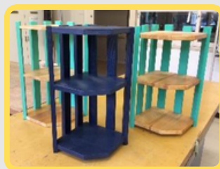
手づくり雑貨の販売