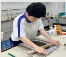
沼隈特別支援学校

三原市大和町のはとむぎ粉を使用した、香ばしくてやさしい味わいのマフィンやクッキーです。野菜は、植え付けから収穫まで、心を込めて丁寧に行いました。ぜひ食べてみてください！ひのきの香りが心地よいスツールは、椅子や脚立、小物置き等いろいろな使い方ができます。