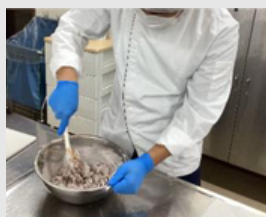
三原特別支援学校

一つ一つ丁寧に作り、焼き色も綺麗です。 一生懸命作りました。味も美味しいので、是非お買い求めください！