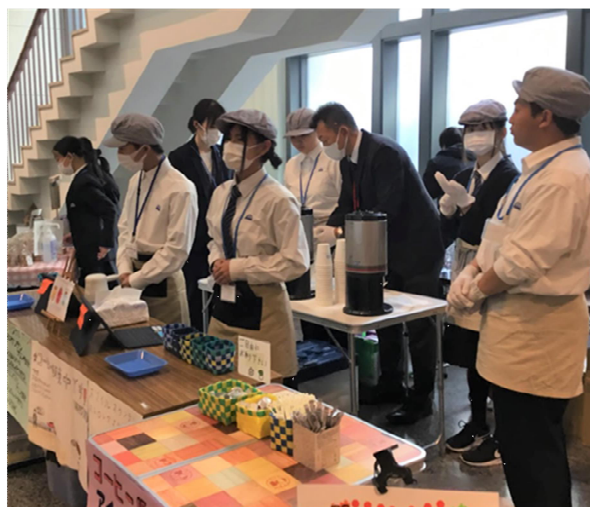
<11月18日（火）の広島県庁会場の様子>