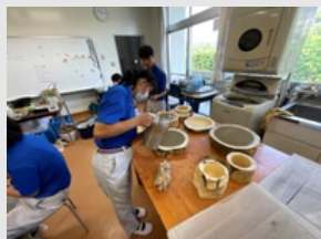
尾道特別支援学校