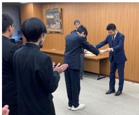
<昨年度の表彰式の様子>

各都道府県の代表校の生徒が、科学技術・理科・数学等における複数分野の筆記競技及び実技競技を行う大会です。今年度が15回目の開催となり、優勝チームは文部科学大臣賞を受賞するとともに、米国で開催されるサイエンスオリンピックへ派遣されます。（主催：国立研究開発法人科学技術振興機構（JST））