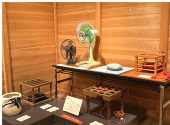
風土記の丘ギャラリー（展示室内の様子）