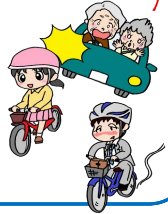
自転車乗車中死者の人身損傷主部位