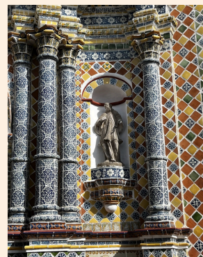
↑サンフランシスコ・アカテペック教会

サンタ・マリア・トナンチントラは、①の教会から坂をくだって20分ほど歩いたところにあります。この教会は残念ながら内部の写真をとることはできなかったのですが、迫力満点な教会でした。見た目は写真にあるような普通の教会ですが、中に入ると壁全体が1つの作品のように様