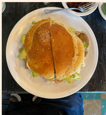
プエブラ、念願のセミータ