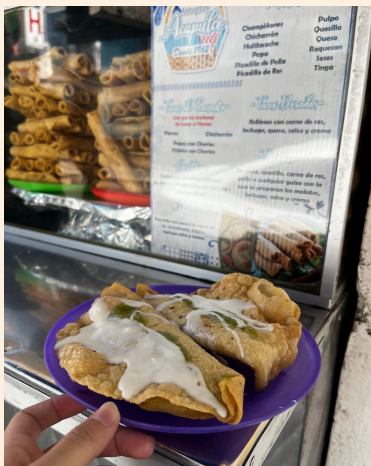
プエブラ旅行で一番 おいしかったローカルフード