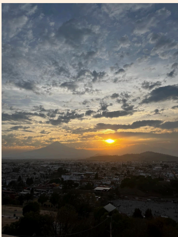
無事ポポカテペトル みれました！