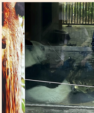
実はメキシコも パンダがいます！