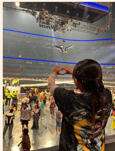
ケイティ・ペリーのライブ 世界観が素敵でした！