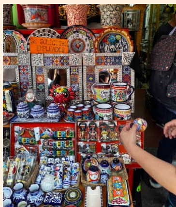
En プエブラのお土産屋さん かわいい