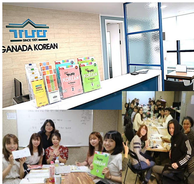
語学研修先：カナタ韓国語学院 教室の様子