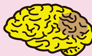
脳血管性認知症による 認知症の脳