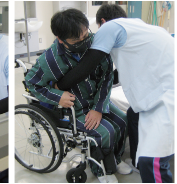
生活支援技術(車イス介助)