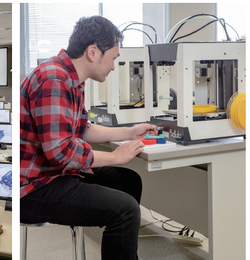
機械設計実習(3Dプリンタ)