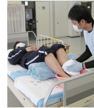
生活支援技術(足浴)