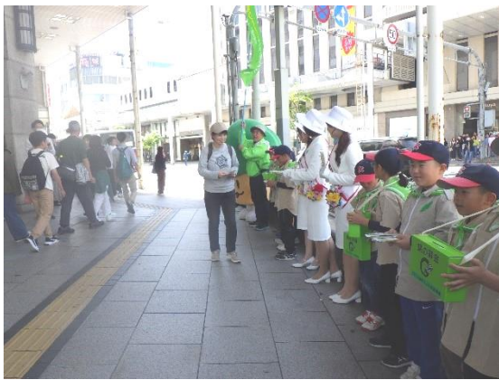
令和6年度実施の様子

令和7年4月13日(日)に、フラワーアンバサダーとともに、募金団体である公益社団法人広島県みどり推進機構と、森林ボランティア団体、緑の少年団、広島県及び広島市が緑の街頭募金を呼びかけます。県民の緑化推進意識の向上にもつながりますので、是非取材いただきますようお願いいたします。