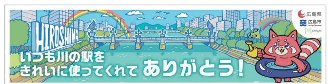
【ミライーね！キャラクターver】