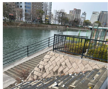
【駅まち協によるおもてなし一斉清掃の様子】