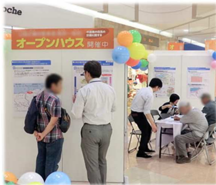
▲オープンハウスの開催イメージ ※他の道路事業での開催状況です

－ オープンハウスとは － 写真やイラスト等を展示し、わかりやすく、検討内容をご紹介します。なお、会場にはスタッフがいますので、 直接説明を聞いたり、質問していただくことができます。