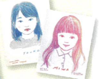
ポートレート スケッチ