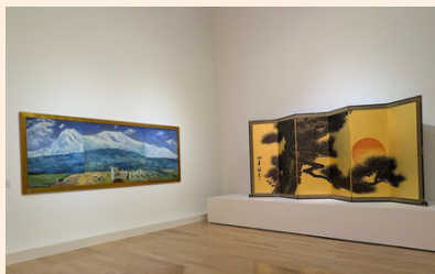
美術館で日本絵画の展示会 少し不思議な気持ち