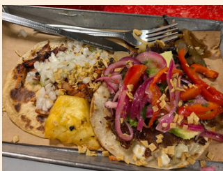
オリノコのタコス 小麦のTortilla