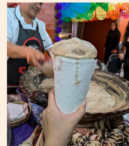
あわあわなチョコレート