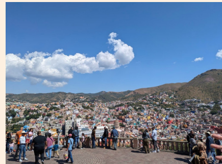
グアナファトの街並み ピピラの丘から