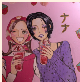
NANAはメキシコでも人気！