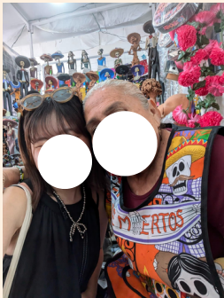
アレブリヘを買った お店のおばあちゃんと一緒に