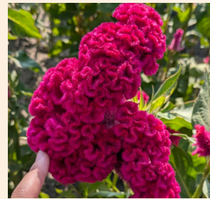
真っ赤なケイトウ、 これも死者の花