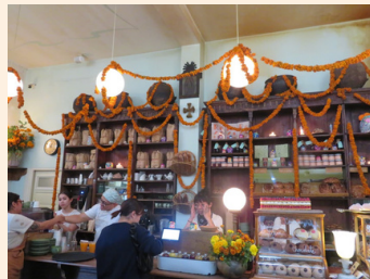
Panaderia Rosetta Dia de Muerto ver.