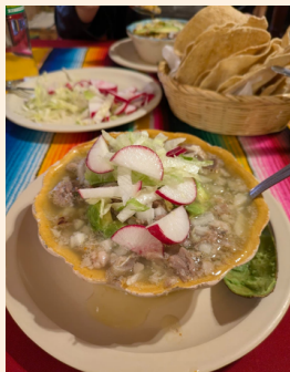
今のところ 一番おいしいPozole