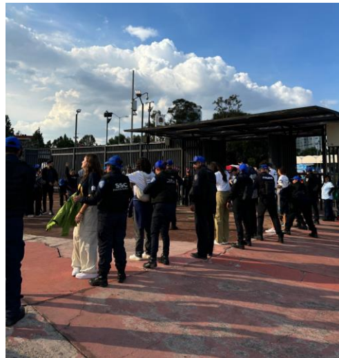
セキュリティチェックの様子