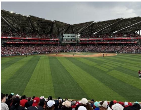
外野席から見た球場の様子

このチームは、日本にゆかりのある選手が多く在籍しており、元広島東洋カープのピレラ選手もスタメンで活躍していました。観戦した日は残念ながら負けてしまいましたが、チームは9月に10年ぶりのリーグ制覇を果たしました！