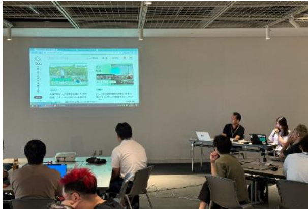
県職員から地域課題の説明