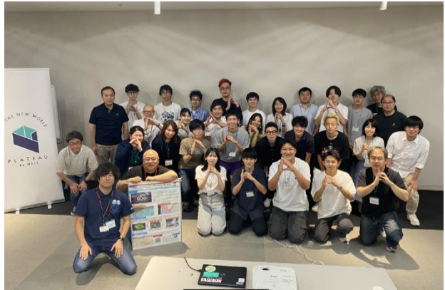
イベント終了後の集合写真