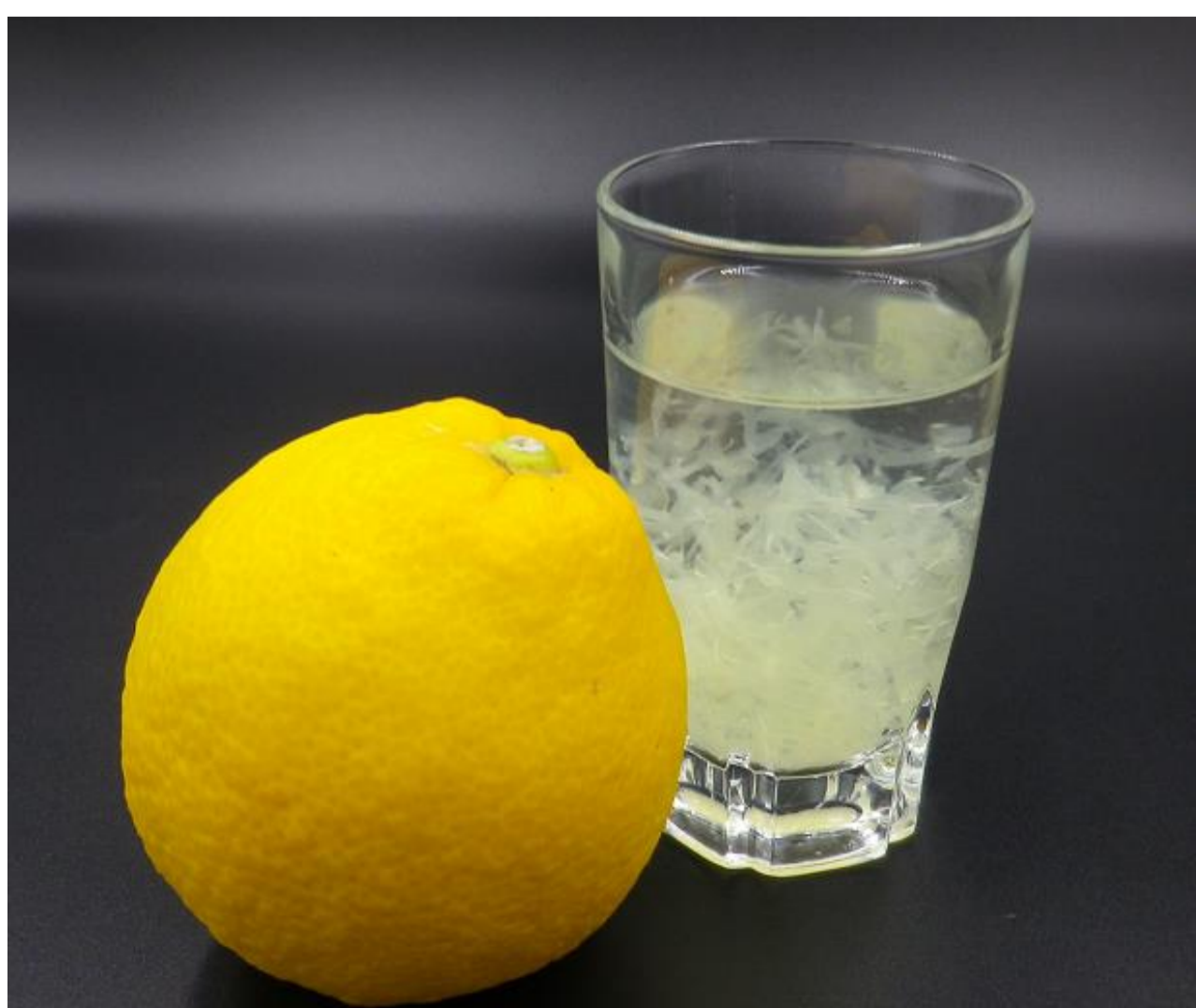
さのう入りドリンク