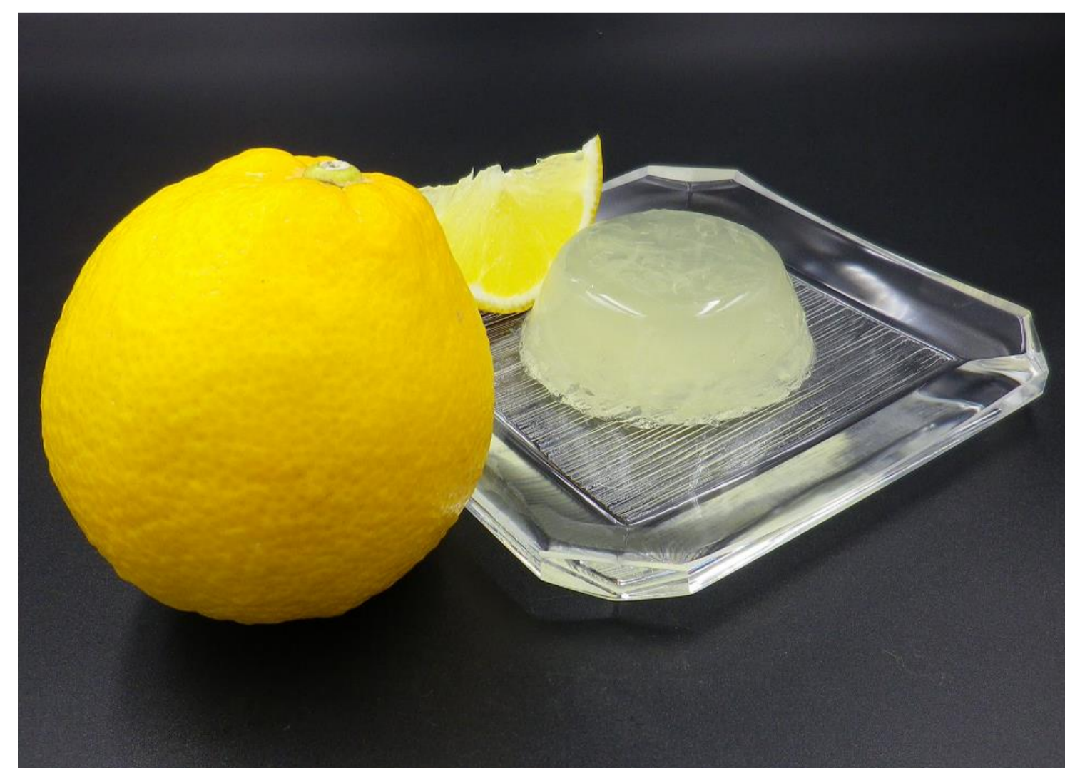
さのう入りゼリー