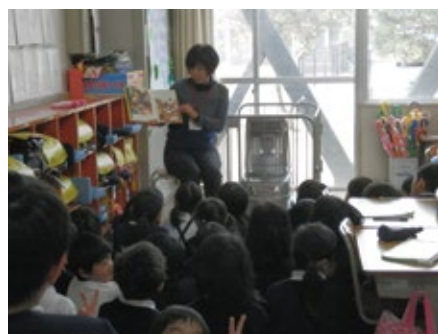
朝の読み聞かせボランティアの様子