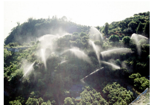
スプリンクラー共同防除