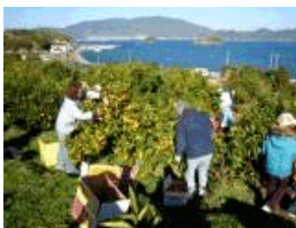
みかんのオーナーによる収穫作業

また、集落内での話し合い活動を続け、非農家を含めた集落全体での水路・農道の整備や鳥獣害防止活動を行っている。