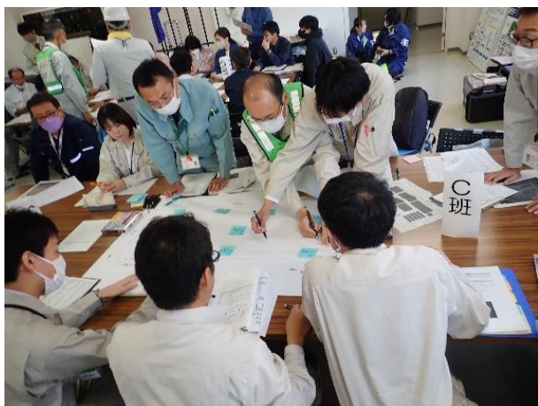
仮置場レイアウトの検討