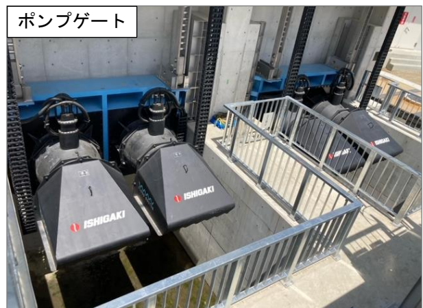
排水機場整備状況