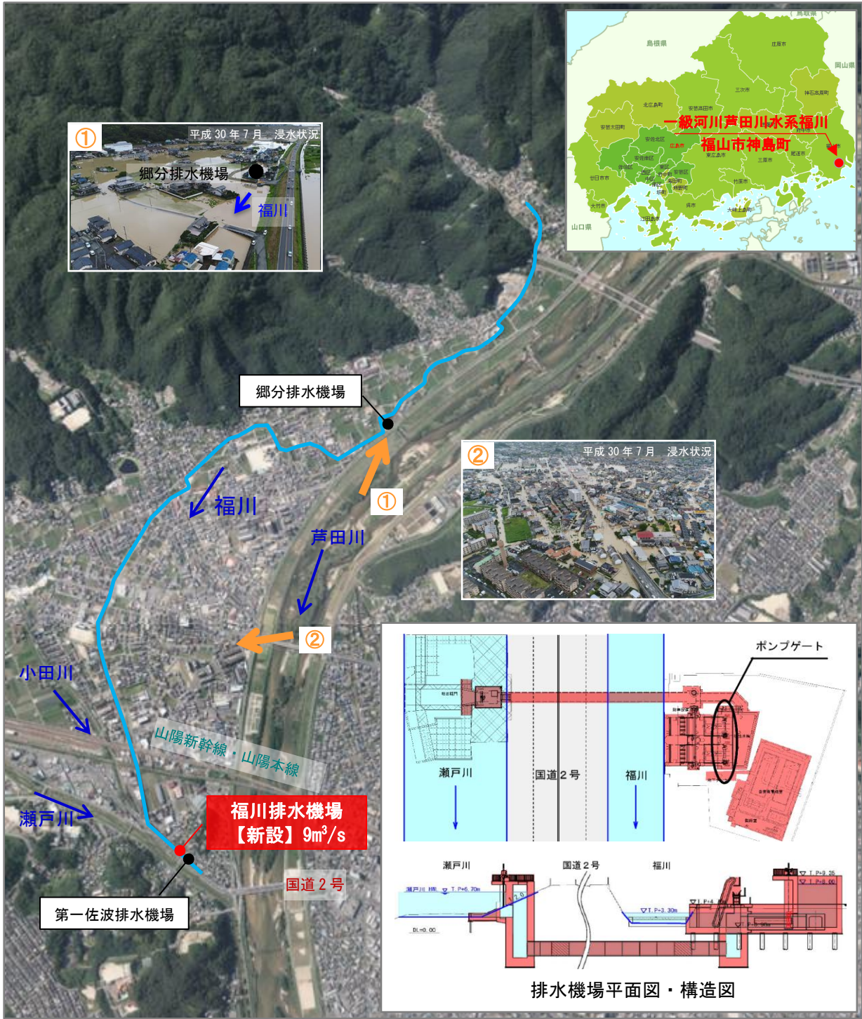
福川排水機場位置図