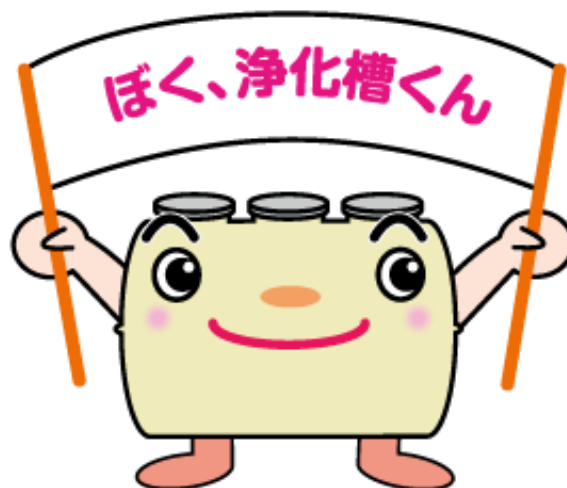
広島県浄化槽キャラクター