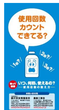
図 農薬工業会リーフレット「使用回数カウントできる?」より https://www.jcpa.or.jp/labo/books/#area02