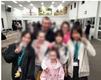
【ホストファミリー】イメージ