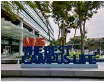
【シンガポール国立大学】イメージ