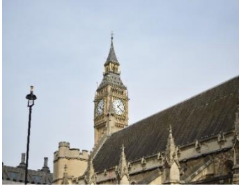
【ロンドン】イメージ