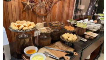
【ホテル朝食】イメージ

フィリピンは東南アジア随一の英語圏。人口1億人の9割以上が公用語、第二外国語として英語に堪能であり、英語人口は米国・インドに次ぎ世界第三位です。新聞やテレビなどの日常生活でも英語が中心です。中でもセブ島はリゾート地としても有名ですが、多くの日本人留学生在が語学留学に選ぶ地域としても有名です。受け入れ語学学校であるHowdy English Academyは多くの日本団体や留学生を受け入れた実績を持ち、日本人にとって安心できる運営体制を整えています。(現地団体：Howdy English Academy)