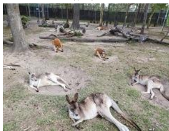
【カラピンワイルドライフサンクチュアリ】イメージ