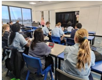
【現地学校】イメージ