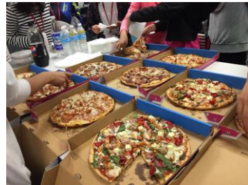
【フェアウェルパーティー】イメージ