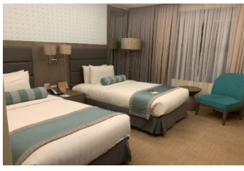
【滞在先ホテル】イメージ