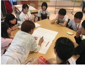
【シンガポール国立大学での研修】イメージ