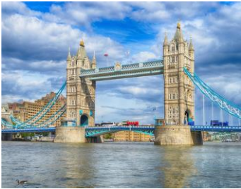
【ロンドン】イメージ