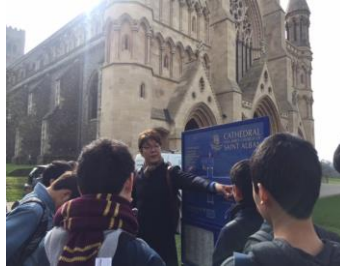
【ロンドン】イメージ