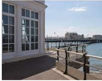
【ワーキング】イメージ