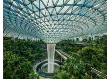
【ジュエル】イメージ

成長し続ける東南アジアの中心都市シンガポールは高い教育水準を誇っています。現地プログラム期間中は、シンガポール国立大学(世界大学ランキング19位)のキャンパス内で講義、ワークショップがあります。今やアジアのトップ大学となり、多くのアジアの優秀な留学生も学んでいます。高いレベルで多様な国籍、背景をもった学生たちがともに学ぶキャンパスは活気に満ち溢れています。(現地運営：ISAシンガポール)