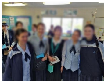
【現地学校】イメージ