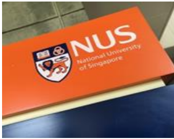
【シンガポール国立大学】イメージ