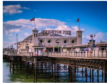
【ブライトン】イメージ