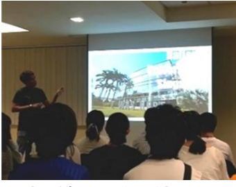
【シンガポール国立大学での研修】イメージ