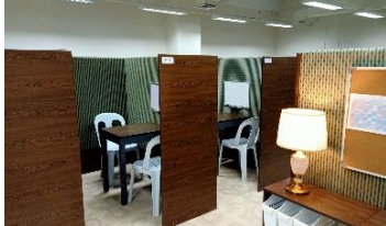
【現地学校】イメージ