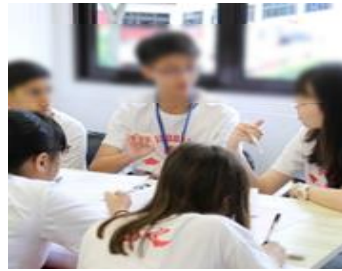
【シンガポール国立大学での研修】イメージ