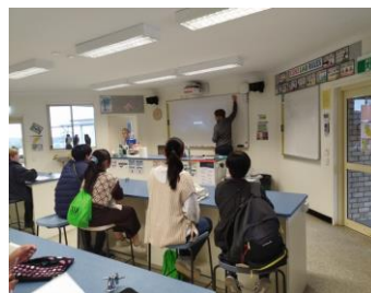
【現地学校】イメージ