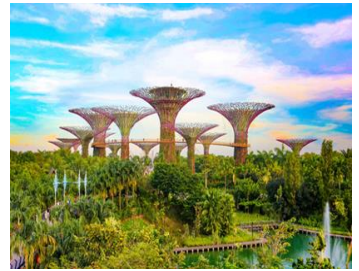
【ガーデンバイザベイ】イメージ