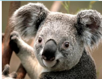
【カラピンワイルドライフサンクチュアリ】イメージ