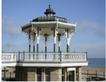
【ブライトン】イメージ

研修期間中に1日、ロンドン終日見学研修を予定しています。世界をリードする金融機関、文化機関、教育機関が密集し、観光地としても人気のあるロンドン。古きを感じる歴史と、最先端に行く近代が共存するその街は、世界各国からの人が集まる多民族国家でもあります。様々な人種、文化、宗教が見え、様々な言語が聞こえてきます。時には、英語であっても、地域ごとにアクセントの異なる様々な方言の英語を聞くことができるかもしれません。(現地運営：Center of English Studies ワーキング校)