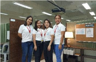
【Howdy English Academy講師】 イメージ