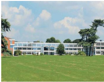
【現地学校 Worthing College】イメージ