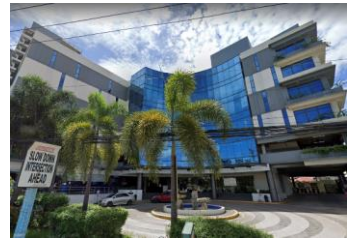
【ショッピングモール】イメージ