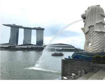
【マライオン】イメージ