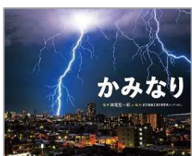
かみなり 妹尾 堅一郎/監修 ポプラ社