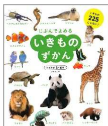
じぶんでよめるいきものずかん 成美堂出版編集部/編 成美堂出版