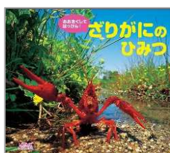
おおきくしてはっけん!ざりがにのひみつ 武田 正倫/監修 ひさかたチャイルド