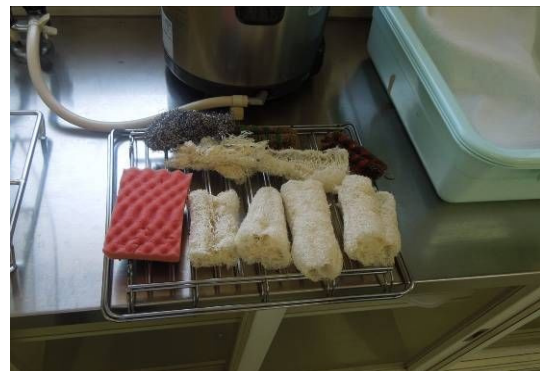
今も家庭科室で使われているヘチマのタワシ