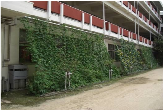
本館1階の緑のカーテン

また、オーシャンブルーとは別に、本館の保健室、生徒指導室などが並ぶ一階部分に、ゴーヤ、ヘチマ、ひょうたんで3種類の緑のカーテンを作った。それぞれ実ができ、生徒や職員が持ち帰ることで、緑化に関する興味関心が高まった。さらにヘチマなどは家庭科の教員がヘチマの実でタワシを作り、文化祭のバザーで販売し、大変好評であった。