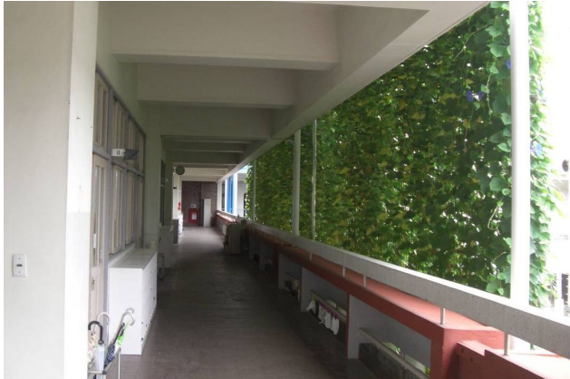
中の廊下側から見た様子