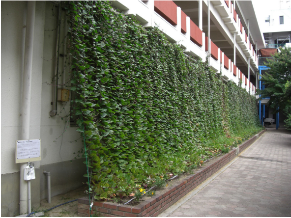
完成したカーテン