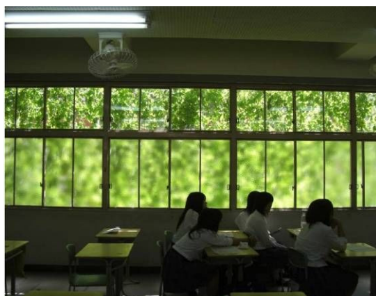
教室の中から見た様子