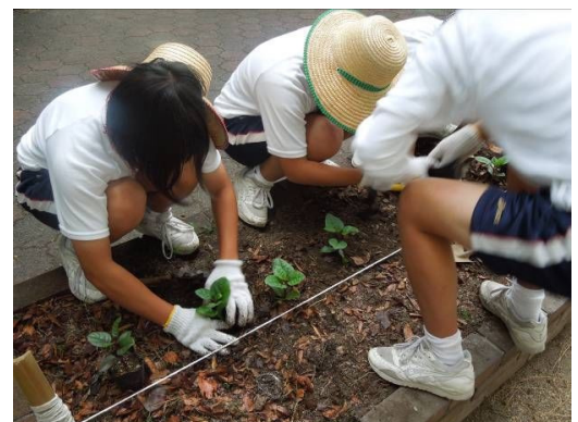
ツルムラサキ定植の様子

授業においてツルムラサキの効果や調理法などを紹介し、生徒たちはカーテンが育って持ちかえられるのを心待ちにしていた。