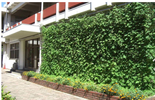
ゴーヤのカーテン

教室から窓を見た時、葉の緑が目にも優しくかった。 収穫したゴーヤを食べる事で夏バテ防止になった。