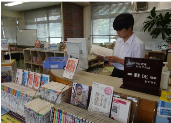
カウンター当番の様子

図書委員が古典に関する図書の紹介のポップを作成し、展示しました。 (「古典の日」の取組)