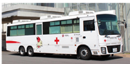
県内を巡回する移動献血バス

広 島県立図書館では、広島県薬務課・広島県赤十字血液センターと連携し、献血に関する正しい知識と必要性を知っていただくため、ポスターの掲示やリーフレットの配布を行うとともに、関連する図書館資料の展示・貸出しを行います。