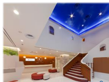
献血ルームもみじ受付

血 液は、同じ人から短期間に何度も採取できず、また、長期保存や人工的な製造もできないことから、広島県では、一人でも多くの方に献血に協力いただけるよう、県内の企業や団体、学校などに呼び掛けています。