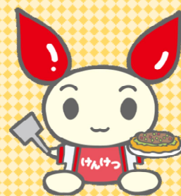
(広島版) 献血キャラクター けんけつちゃん