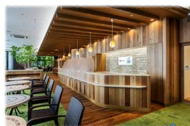
献血ルームピース受付

献 血で得られた血液は、主に、がんや白血病などの病気の治療に使われていますが、献血に協力して下さる方は、全国的に減り続けています。