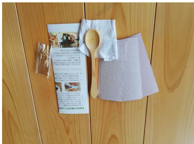
ネズミサシを使ったスプーン (購入者が自分で切削します)

【事業者名】 有限会社一場木工所 【活用した制度】 設、指 【利用したセンター】 林業技術センター