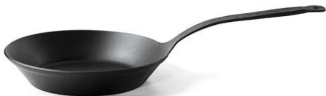
鍛接の様子（上）とアウトドア用フライパン cocinero（下）（自由鍛造と鍛接技術を利用）

【事業者名】株式会社三暁 【活用した制度】設 【利用したセンター】東部工業技術センター