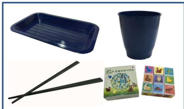
トレー、植栽ポット、箸、パズル

【事業者名】株式会社エコログ・ リサイクリング・ジャパン 【活用した制度】 設、指 【利用したセンター】東部工業技術センター