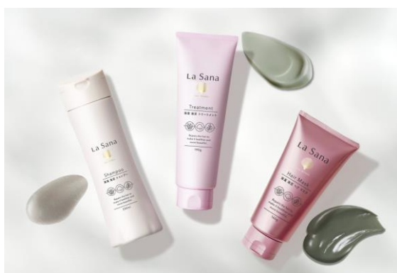
ラサーナ ダメージヘアケア シリーズ

【事業者名】株式会社ヤマサキ 【活用した制度】 設 、 ギ 【利用したセンター】食品工業技術センター