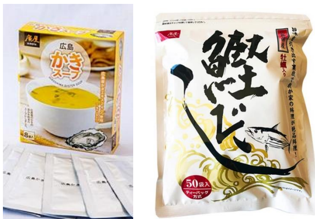
かきの風味豊かな粉末スープ 手軽に使えるプロのだし

【事業者名】株式会社広島ヤンマー商事 【活用した制度】設、指 【利用したセンター】食品工業技術センター