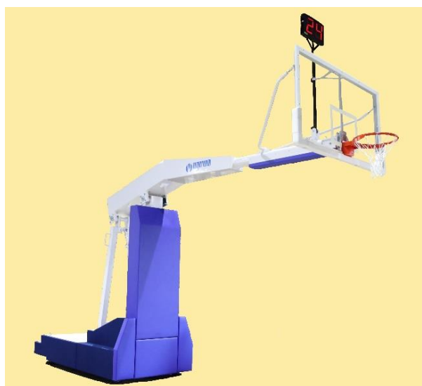
スパイラルゴール（移動式バスケットゴール）

【事業者名】株式会社小川長春館 【活用した制度】設、指 【利用したセンター】東部工業技術センター