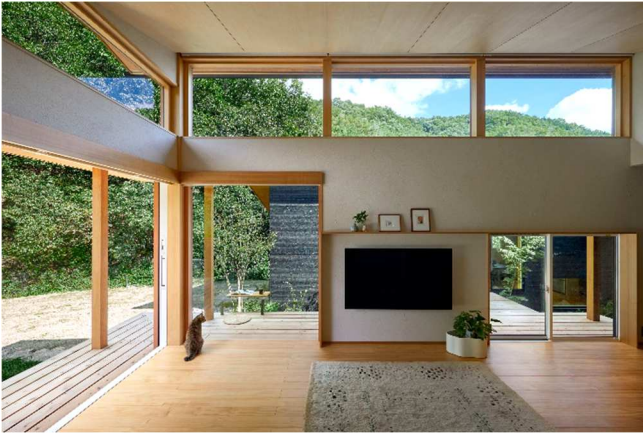
自然の景色と光を取り込む大開口。室内からも四季の移ろいを感じられる。