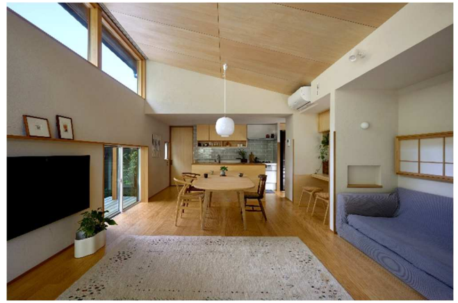
家族が集まる開放感のあるLDK。内装は経年劣化を趣として楽しむ自然素材を使用。