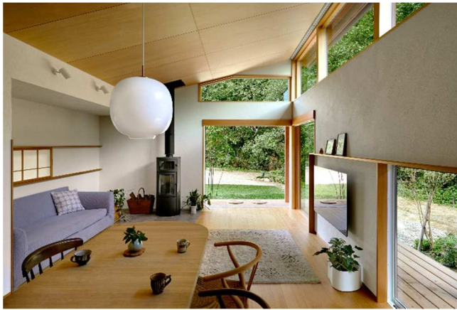
自然光をうまく取り入れ、照明は必要な場所に必要だけ配置した。