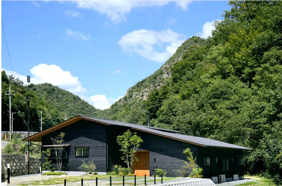
山並みに馴染む外観

【設計・施工・企画立案者】 國本 広行 【國本建築堂 株式会社】 TEL:0848-38-9091