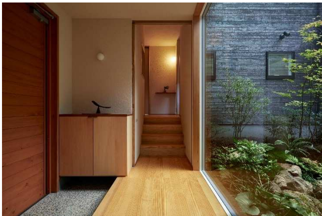
玄関を入ると、中庭が見える大開口↑