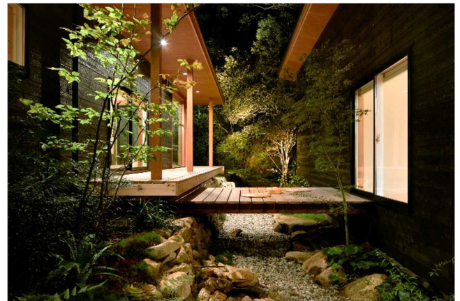
玄関を開け、目の前に飛び込んでくる中庭の景色。中庭と自然の景色が一続きになるよう植栽を計画した。