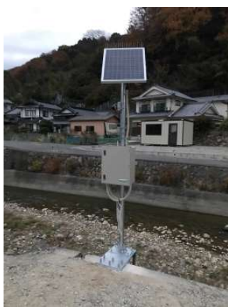
【簡易型河川監視カメラ設置例】