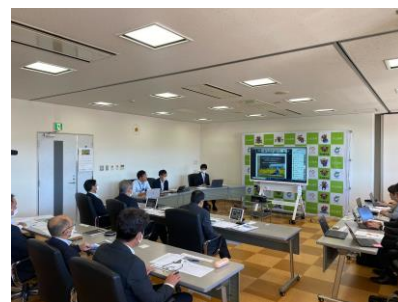
<北広島町長へのプレゼン>