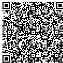
電子申請システム (歴風トーク)