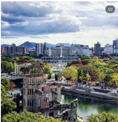
ポートクラウドから 望む平和記念公園 ( akilaw51 さん)