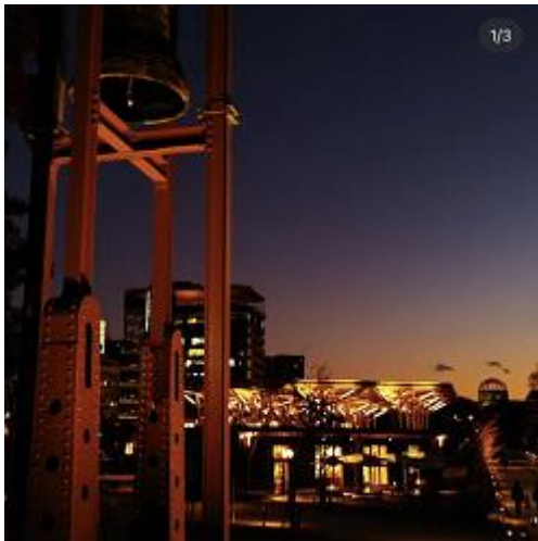
ひろしまゲートパーク (ユーザー名：pinto_kool さん)