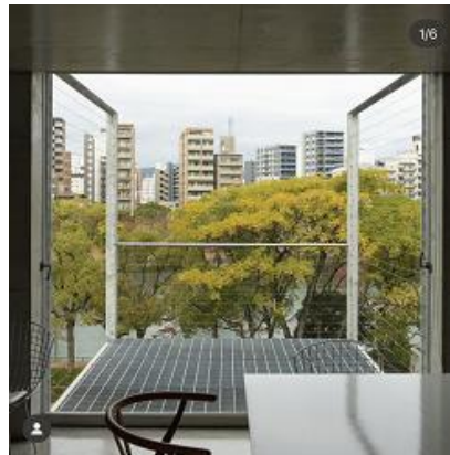
比治山本町のアトリエ ( kezijajones さん)