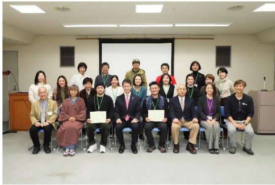
【生活課題解決コース】