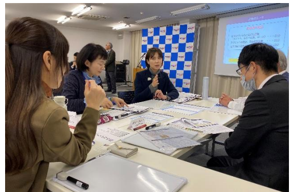
写真：第2回企業経営者交流イベント グループワークの様子

また今回は、広島東洋カープ元監督の野村謙二郎氏をお招きし、選手時代・監督時代に強い組織をつくるために注力したポイントなど、ご自身のマネジメント体験を踏まえて講演いただきます。