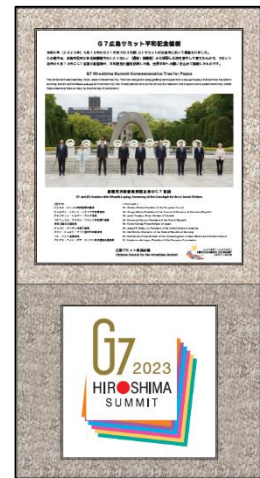
説明板のデザイン（イメージ）