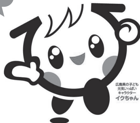
広島県の子ども 元気いっぱい キャラクター イクちゃん