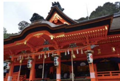
修理が完成した吉備津神社本殿(重要文化財)

地元では「いっきゅうさん」と呼ばれる備後一宮 吉備津神社(福山市)は、大同元年(806)に創建されたと伝わる古社です。令和4年、重要文化財本殿が保存修理を終えました。本展では、吉備津神社に伝えられた文化財を中心に、関連資料を展示するとともに、保存修理についても紹介します。