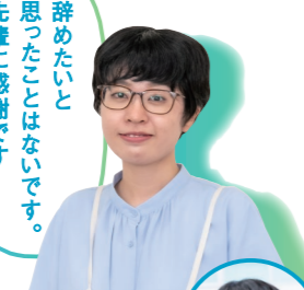
Sさん 社会福祉法人 江能福祉会 特別養護老人ホーム 江能 広島国際医療福祉専門学校 人間総合福祉学科卒 Vol.4 当番