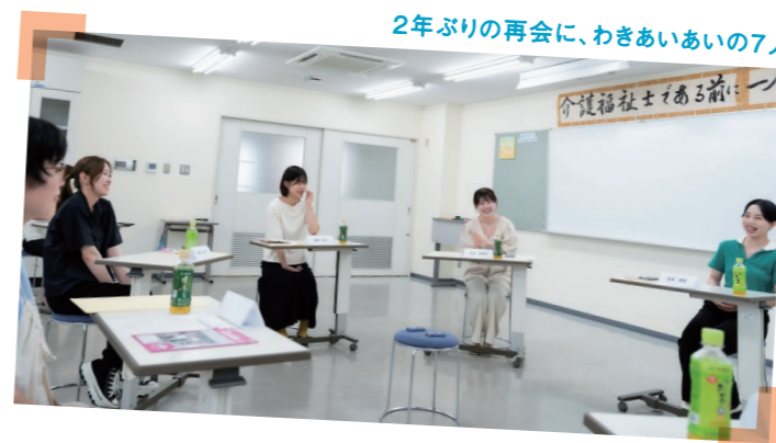
2年ぶりの再会に、わきあいの7人

Gentle vol.4 (2021年発行)内のクロストーク「わたしたちが選んだ『介護』の理由」にて、当時介護を勉強する学生だった5人が福祉・介護の仕事を目指すきっかけや将来の夢を語り合いました。いまは社会人となった彼女たちに再集結してもらい、仕事のことや、リアルな気持ちをお聴きしました。そんな同窓会の一部をお届けします。