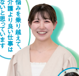
Aさん 社会福祉法人 和楽会 特別養護老人ホーム 和楽荘 トリニティカレッジ広島医療福祉 専門学校 介護福祉学科卒 Vol.4 当番