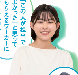
Rさん 安佐南区役所 厚生部 生活課 広島文教大学人間科学部 人間福祉学科卒 Vol.4 当番