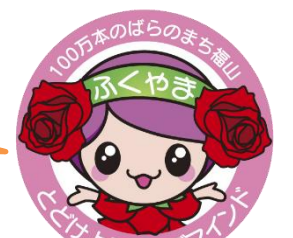
ばらのまち福山 イメージキャラクター「ローラ」